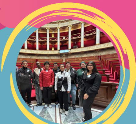
Des séjours jeunes tout au long de l'année

Tout au long des vacances scolaires : Projets, activités et sorties coconstruites avec et pour les jeunes